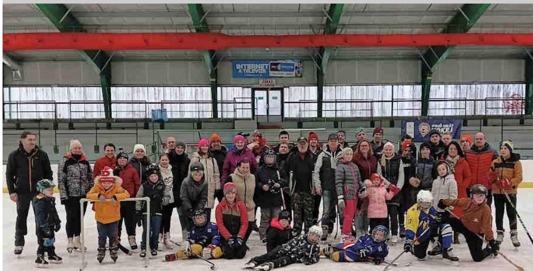
Silvestrovské bruslení 31. 12.