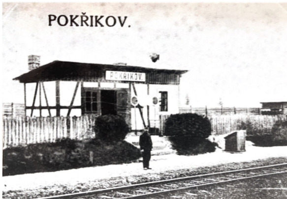
Čerpáno z pamětní knihy obce Pokřikov