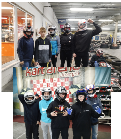
Motokáry podzim 2023