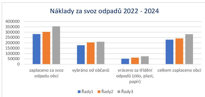
Náklady za svoz odpadů 2022 - 2024